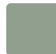
Park 085 S 4010-G30Y