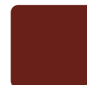
Rosenknopp 059 S 6030-Y90R