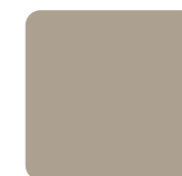
Lergrå 047 S 4005-Y20R